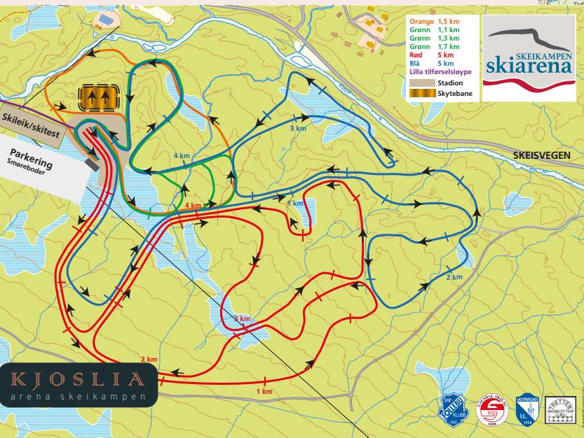
Konkurranseløyper Skeikampen Skiaren